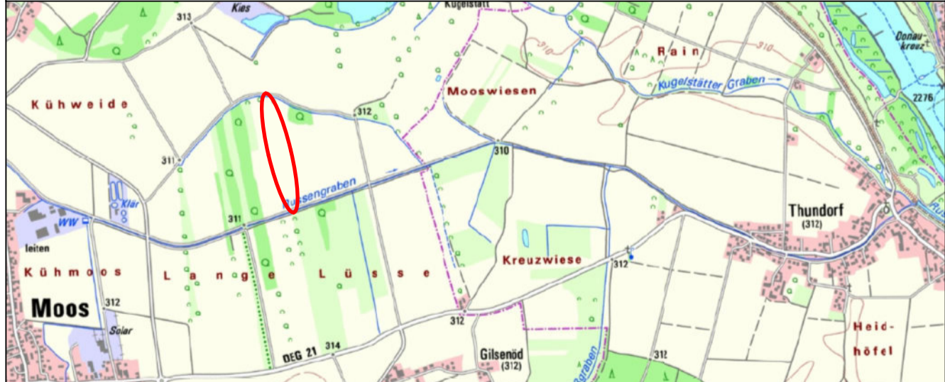
Übersichtsplan 1 : 25.000

Planunterlagen: Grundkarte erstellt von Ingenieurbüro Geoplan, Osterhofen, auf digitaler Flurkarte der Bayerischen Vermessungsverwaltung. Untergrund: Aussagen über Rückschlüsse auf die Untergrundverhältnisse und die Bodenbeschaffenheit können weder aus den amtlichen Karten, aus der Grundkarte noch aus Zeichnungen und Text abgeleitet werden. Nachrichtliche Übernahmen: Für nachrichtlich übernommene Planungen und Gegebenheiten kann keine Gewähr übernommen werden. Urheberrecht: Für die Planung behalten wir uns alle Rechte vor. Ohne unsere Zustimmung darf die Planung nicht geändert werden.