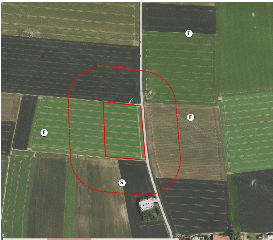
Abbildung 6: Lage der Revierzentren von Feldlerche (F) und Schafstelze (S), rote Linie: Grenzen des Vorhabensbereiches – Umspannwerk Buchhofen und Sondergebiet mit Zweckbestimmung Speicher mit Wasserstoffproduktion, rot gestrichelt: 100-Meter Puffer, Hintergrund Quelle: https://geoportal.bayern.de/bayernatlas/ )