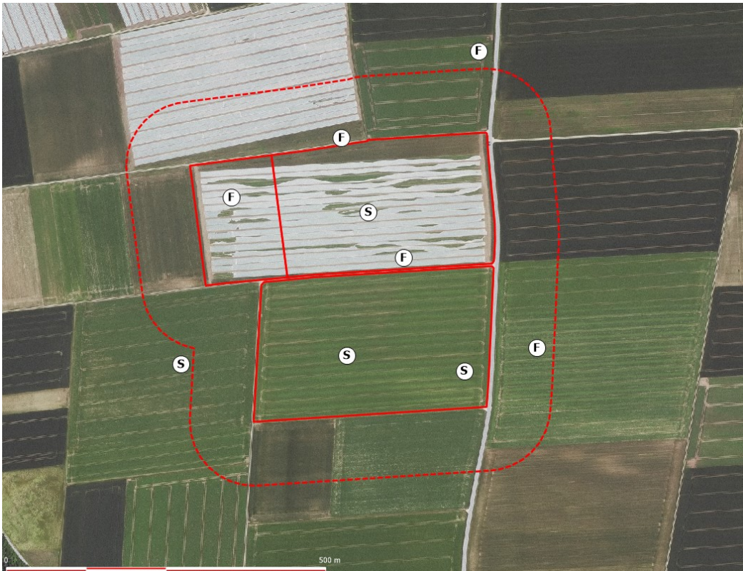
Abbildung 3: Lage der Revierzentren von Feldlerche (F) und Schafstelze (S), rote Linien: Flächen der geplanten Solarparks Langenisarhofen IV West, Ottmaring und PV-Park an der Kreisstraße DEG 31, rot gestrichelt: 100-Meter Puffer, Hintergrund Quelle: https://geoportal.bayern.de/bayernatlas/ )