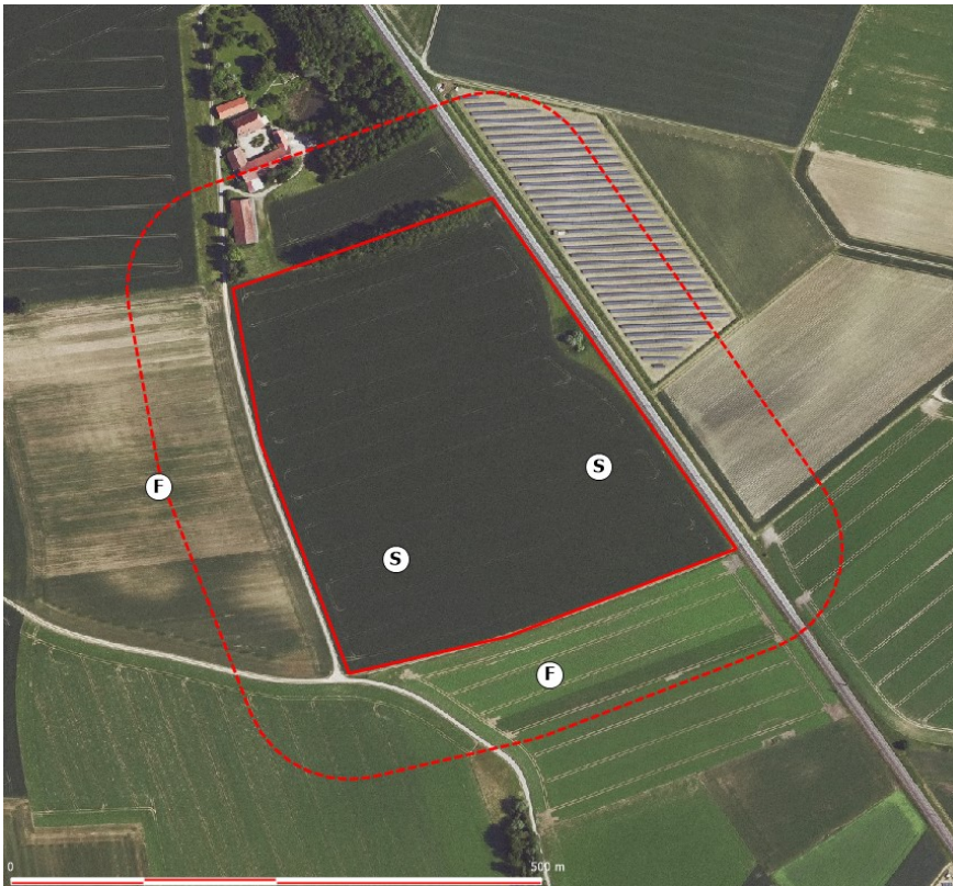
Abbildung 5: Lage der Revierzentren von Feldlerche (F) und Schafstelze (S), rote Linien: Flächen des geplanten Solarparks Lahnhof, rot gestrichelt: 100-Meter Puffer, Hintergrund Quelle: https://geoportal.bayern.de/bayernatlas/ )