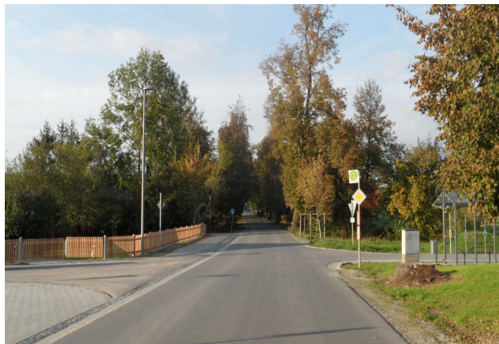
Schlossallee, Einmündung Martlstraße (vorher und nachher)