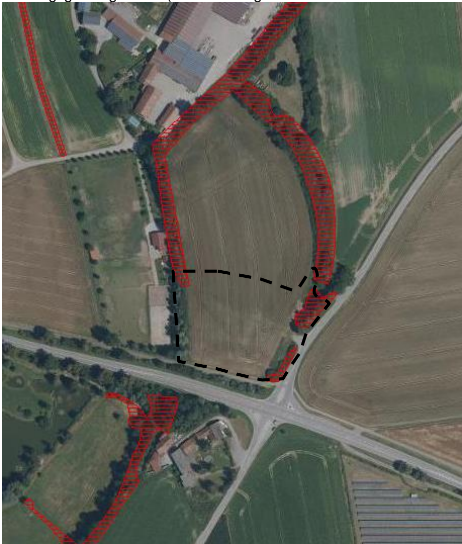
Übersichtskarte mit amtlich kartierten Biotopen (nicht maßstäblich, BayernAtlas 2018)

Die Fläche des Baufeldes wird momentan intensiv als Ackerfläche genutzt. Ein amtlich kartierter Biotop (7243-0097) befindet sich angrenzend zum Planungsgebiet. Dieser ist in drei Teilgebiete unterteilt, von denen die Teilbereiche 002 und 003 direkt ans Planungsgebiet grenzen (Beschreibungen im Umweltbericht zum Bebauungsplan).