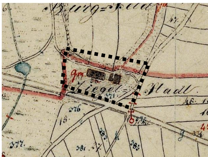
Damalige Nutzung des Planungsgebietes (BayernAtlas 2018)

Nördlich des Vorhabens befindet sich der Weiler Burgstall. Im Westen und Osten befinden sich einige Gehölzbestände und Hecken, welche durch das Planungsvorhaben nicht beeinträchtigt werden. Zur angrenzenden Bundesstraße 8 wird das Planungsgebiet von einem Radweg und einem Gehölzbestand abgetrennt