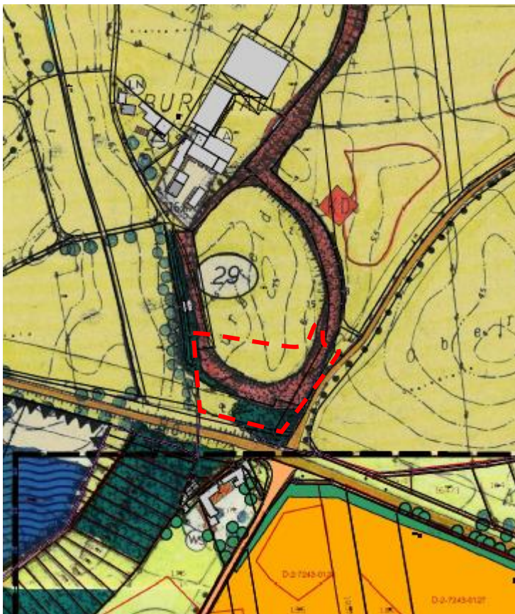
Auszug aus Flächennutzungsplan (Verwaltungsgemeinschaft Moos)