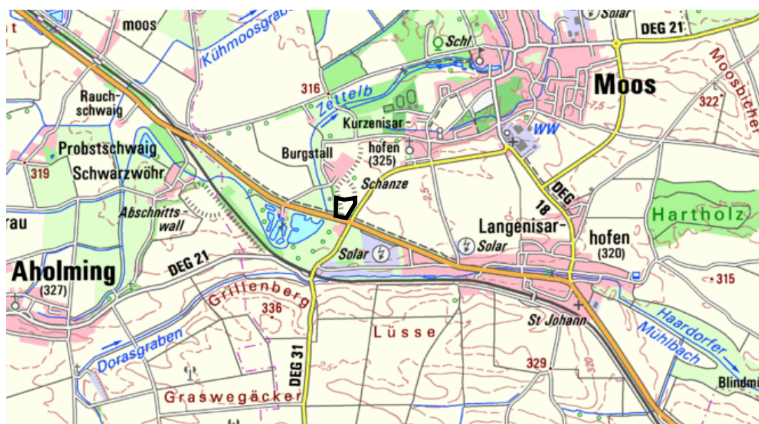
Übersichtskarte (nicht maßstäblich, Bayernatlas 2018)

Im weiteren Umgriff der Flächen befinden sich landwirtschaftlich intensiv genutzte Flächen, Gehölzbestände/Hecken, ein Radweg und ein Bodendenkmal. Die Flurstücke selbst werden derzeit teilweise landwirtschaftlich intensiv genutzt. Auf den Flurstücken am östlichen bzw. westlichen Rand des Geltungsbereiches befinden sich Gehölzbestände (teilweise amtlich kartierte Biotope).