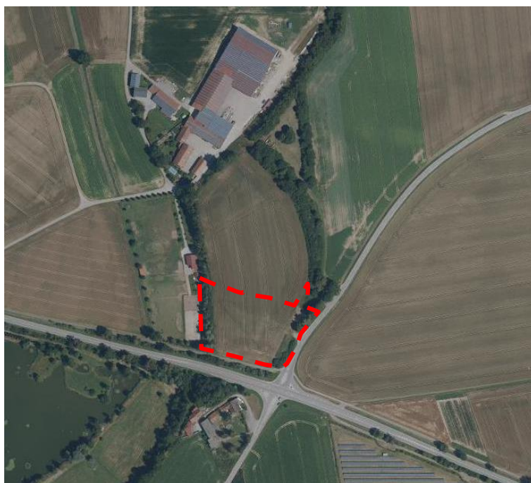
Übersichtskarte (nicht maßstäblich, BayernAtlas 2018)

Das Planungsgebiet liegt in der Gemeinde Moos südwestlich von Kurzenisarhofen im Ortsteil Burgstall. Das Planungsgebiet befindet sich südlich des Ortsteiles. Eine Zufahrtmöglichkeit zum Planungsgebiet besteht über eine bestehende Zufahrt über die Kreisstraße DEG 21 bzw. den Ortsteil Burgstall. Die geplante Fläche wurde als Bauschuttdeponie genutzt, welche wieder verfüllt wurde. Vor der Nutzung als Bauschuttdeponie wurde die Fläche als Standort für Rohstoffabbau genutzt. Zudem wurde die gesamte Hangkante als Kiesabbau genutzt.