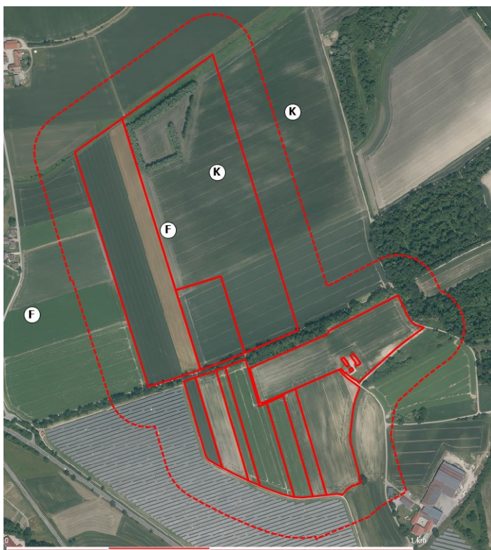
Abbildung 1: Lage der Revierzentren von Feldlerche (F) und Kiebitz (K), rote Linien: Flächen des geplanten Solarparks Burgstall West II, rot gestrichelt: 100-Meter Puffer, Hintergrund Quelle: https://geoportal.bayern.de/bayernatlas/ )